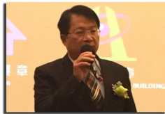
臺南市 副市長 顏純左